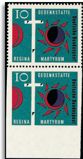
397Udr ** Fotoattest Schlegel BPP 373,-