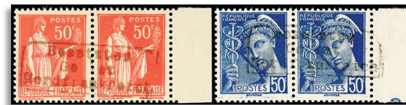
2/3I ** Fotoattest Lothar Herbst VP 311,-