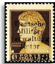
1P ** Fotoattest Krichke BPP 621,-