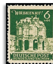
64BC ** Fotoattest Ströh BPP 373,-