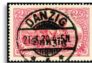
12c Fotoattest Soecknick BPP 435,-