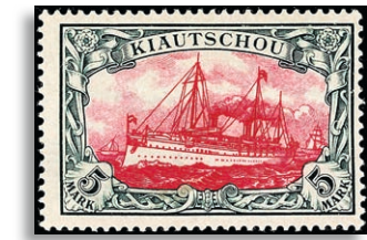
17 ** gepr. Kilian BPP 336,-