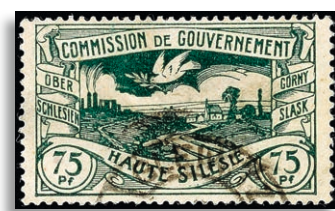
24b Fotoattest Gruber BPP 497,-