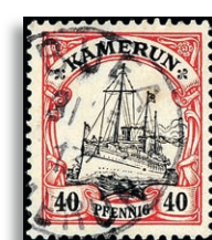
13II gepr. Jäschke-Lantelme BPP 349,-