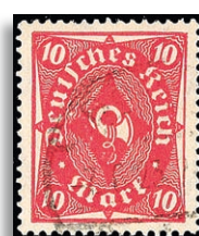
206WF Fotoattest Bechtold BPP 373,-