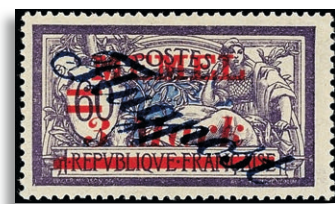
79II ** Attest Klein VP 499,-