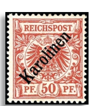
6l * signiert W. Engel und Bartels 311,-