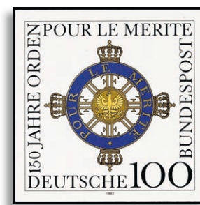
1613U ** Fotoattest Schlegel BPP 348,-