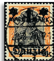
26III Fotoattest Soecknick BPP 497,-