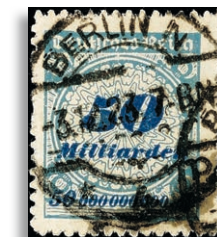
330B Fotoattest Winkler BPP 373,-