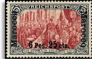
19I/1 * gepr. Steuer VÖB 585,-