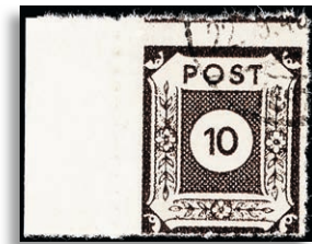
45L Fotoattest Ströh BPP 286,-