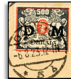
39 Fotoattest Gruber BPP 286,-