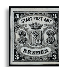
1x Type * Fotoattest Heitmann BPP 274,-