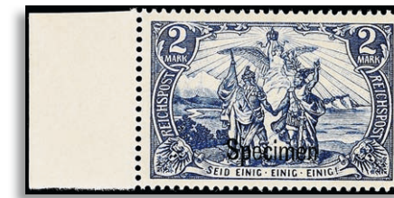
64ISP ** Fotoattest Jäschke BPP 311,-