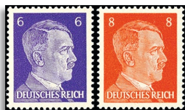
23/26 ** Fotoattest Pielies BPP 311,-