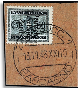
8 Fotoattest Ludin BPP 559,-