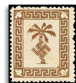
5a ** Fotoattest Gabisch BPP 311,-