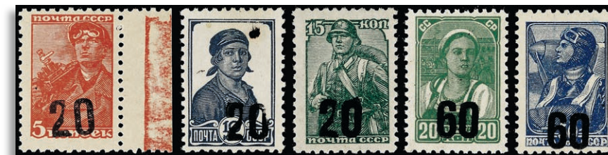
IV ** gepr. Krichke BPP 311,-