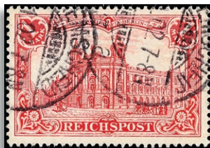
63aIII Fotoattest Jäschke-Lantelme BPP 497,-