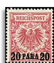
7ca * Fotoattest Jäschke-Lantelme BPP 435,-