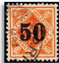
188 Fotoattest Winkler BPP 497,-