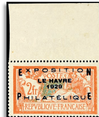
239 ** sign. u. a. Star(aushek) 373,-