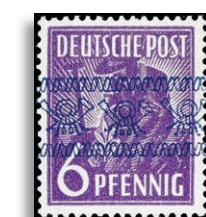
37IFI ** Fotoattest Schlegel A. BPP 373,-