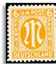
20PII ** Fotoattest Hettler BPP 311,-