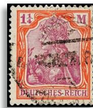
151Y gepr. Bechtold BPP 550,-