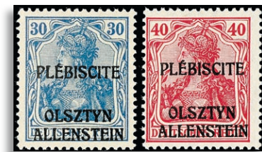
II/VI ** Fotoattest Mikulski AIEP 373,-