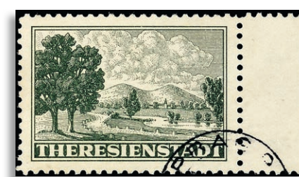
1 Fotoattest Pfeiffer BPP 373,-