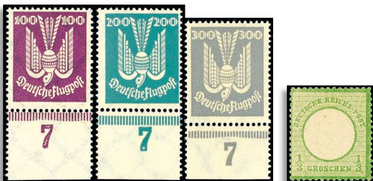
344/50 ** Fotoattest H.-D. Schlegel BPP 621,-