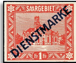
111IU ** 311,-