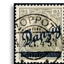
33OO Fotoattest Oechsner BPP 324,-