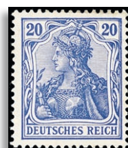
72b * Attest Jäschke-Lantelme BPP 399,-