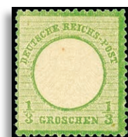
2a * Fotoattest Brugger BPP 274,-