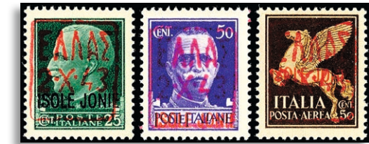
1/3II ** Fotoattest Brunel VP 286,-