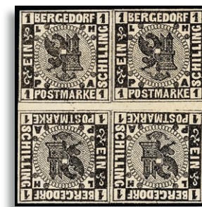
2KZS ** gepr. W. Engel BPP 311,-