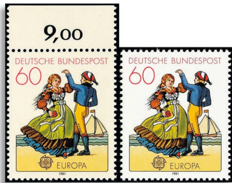
1097G ** Fotoattest Schlegel BPP 745,-