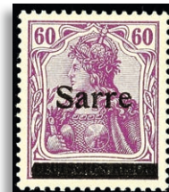
14al ** Fotoattest Braun BPP 374,-