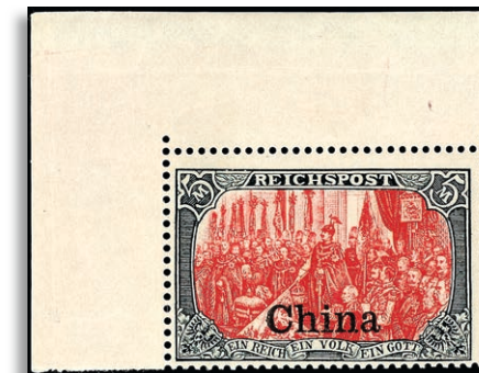
27II ** unsigniert 373,-