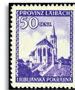
49II ** Fotoattest Kleymann BPP 286,-