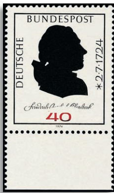
809FII ** Fotoattest Schlegel BPP 311,-